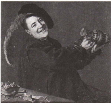
De vrolijke drinker van Judith Leyster (1629) met de attributen van de volmaakte roker: pijp, tabak, lange lucifers en vuurpot. Rijksmuseum, Amsterdam. (Afb. van het museum)

Het allereerste begin van het tabaksgebruik is ons vooral bekend uit de genadeloze verbodsbepalingen van de overheid (voor deze de aantrekkelijke mogelijkheden had ontdekt om er belasting over te heffen; in 1674 stelde de Franse Staat het tabaksmonopolie in). Deze verbodsbepalingen werden in vrijwel de gehele wereld uitgevaardigd: Engeland in 1604; Japan 1607-1609; het Osmaanse Rijk in 1611; het Mogol-Rijk in India in 1617; Zweden en Denemarken in 1632; Rusland in 1634; Napels in 1637; Sicilië in 1640; China in 1642; de